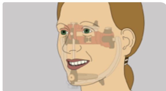
Modulele software de baza permit utilizatorului sa programeze articuloarele si sa exporte datele reale ale miscarilor.