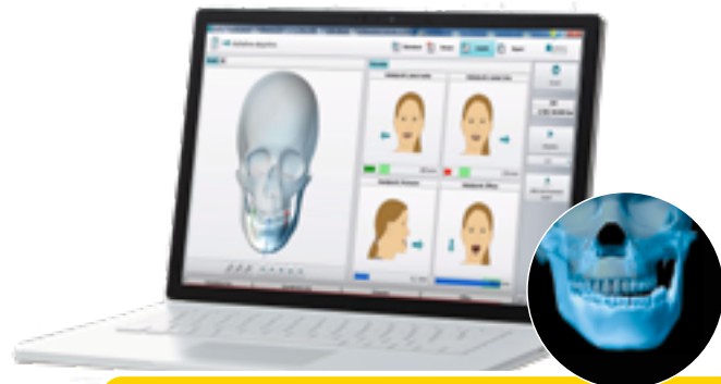
Sistemul de analiza este operat prin intermediul unui computer personal conventional avand sistem de operare Windows 10.

Portabil: Pastreaza si transporta intregul sistem in cutia de transport inclusa.