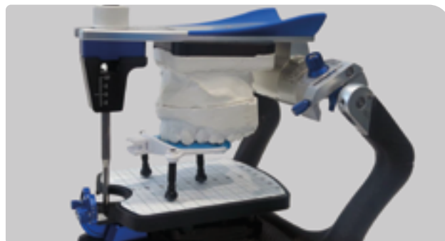
Stand pentru transferul pozitiei maxilarului la articuloarele clasice folosind placuta de transfer.