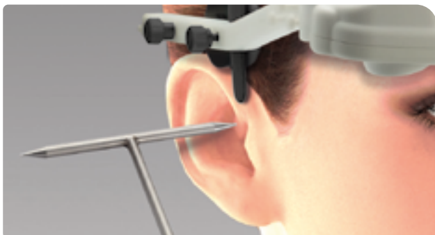
Precis si sigur – intrarea punctelor arbitrare de referinta prin intermediul T-pointer

Placuta de transfer patentata stabileste relatia exacta intre informatiile privind miscarile obtinute prin sistemul de masurare si suprafetele dentare scanate prin intermediul scannerului de modele (Tizian Smart-Scan Plus) sau a scannerelor intraorale. In acelasi timp, placuta de transfer este o parte componenta a noului stand de transfer zebris si faciliteaza transferul facil a pozitiei maxilarului catre un articulador clasic. Folosirea unui arc facial clasic nu mai este necesara.